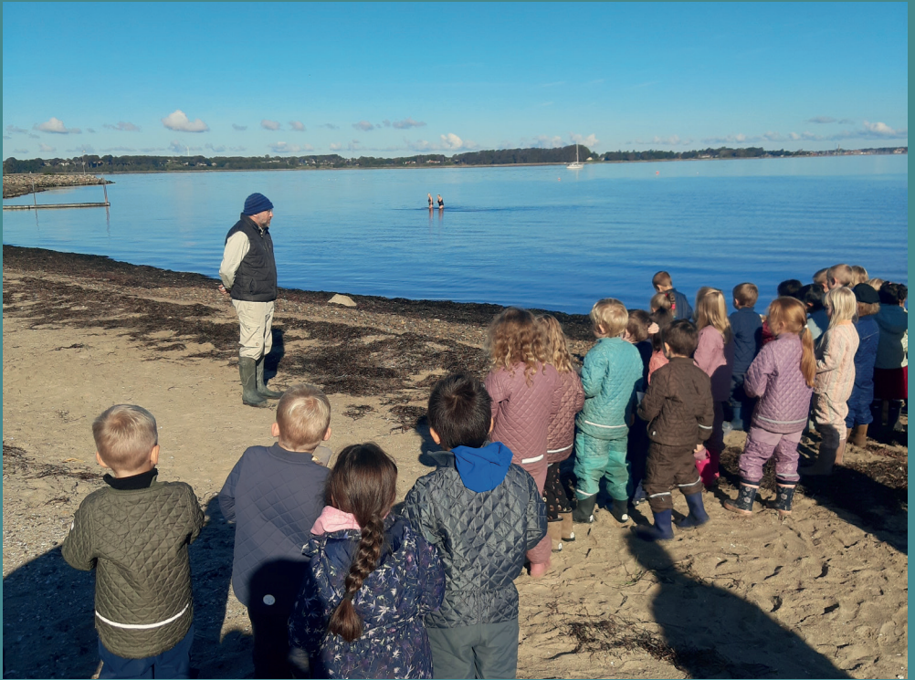
Naturvejledning på stranden ved Glyngøre Kulturstation med en hel børnehave.