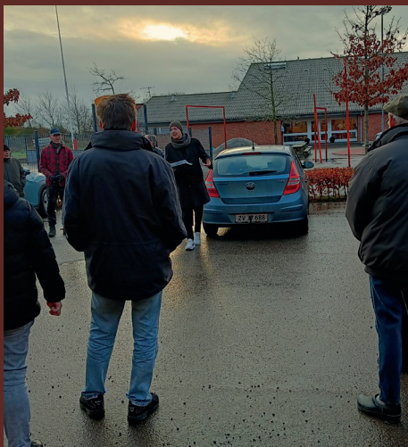
< Velbesøgt byvandring en råkold decemberdag i Rønbjerg.